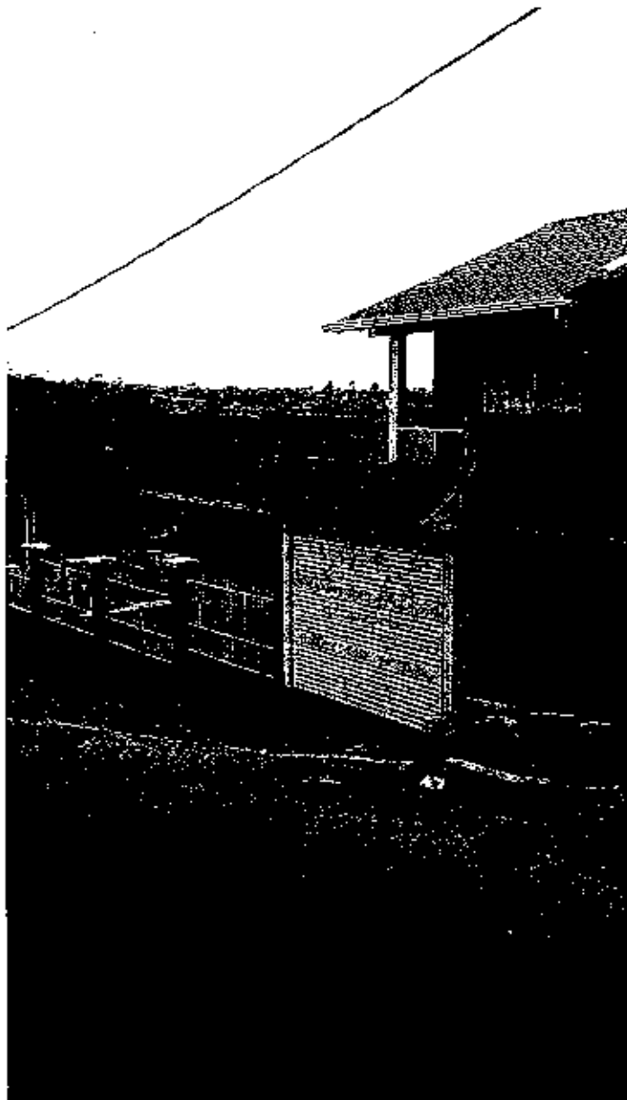
Terreno baldio, lado direito ao número 446, na Rua Pedro Anísio.