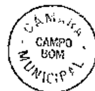
LUCIANO LIBÓRIO BAPTISTA ORSI, Prefeito Municipal.