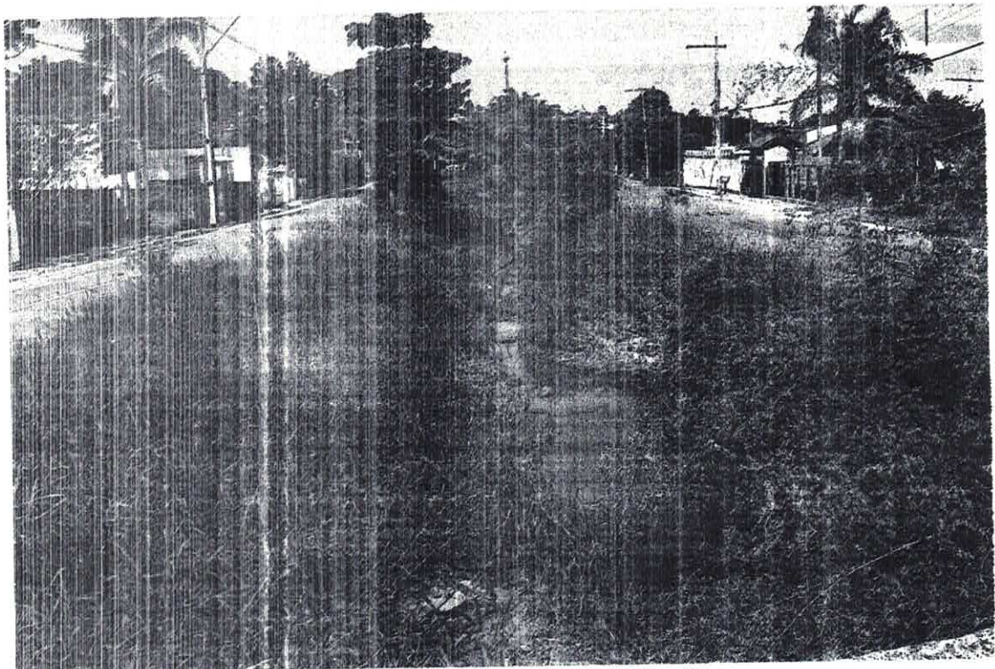
ARROIO WEIDLER, SENTIDO BAIRRO/CENTRO