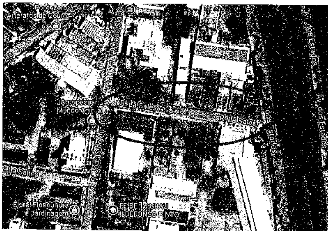
Rua La Salles, trecho entre a Av. Dos Estados e Rua João S. do Amaral, fundos da empresa de calçados AREZZO, centro de Campo Bom