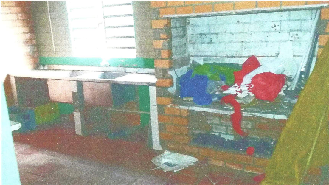
PIAS E BANCADAS