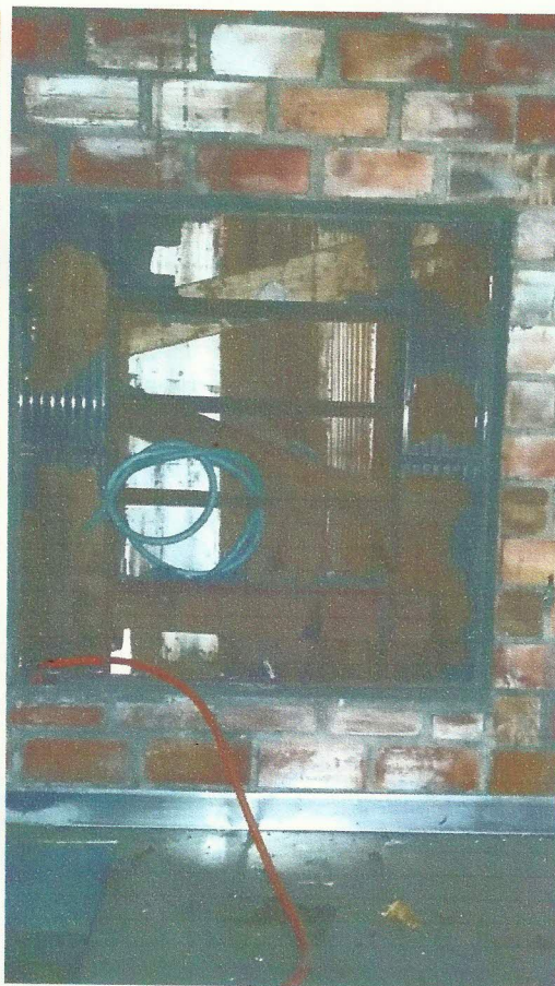
BANHEIROS E VIDROS QUEBRADOS