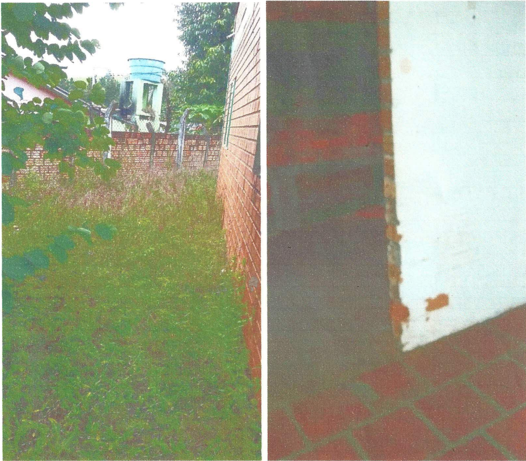
MATO ALTO E PISO ENCARDIDO