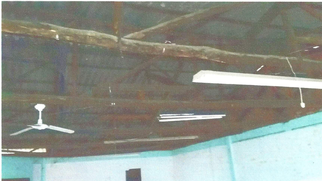
COBERTURA SEM FORRAÇÃO