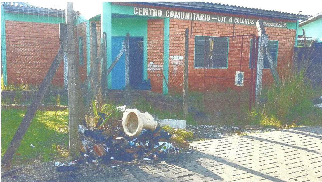
ENTRADA DA SEDE DA ASSOCIAÇÃO DE MORADORES