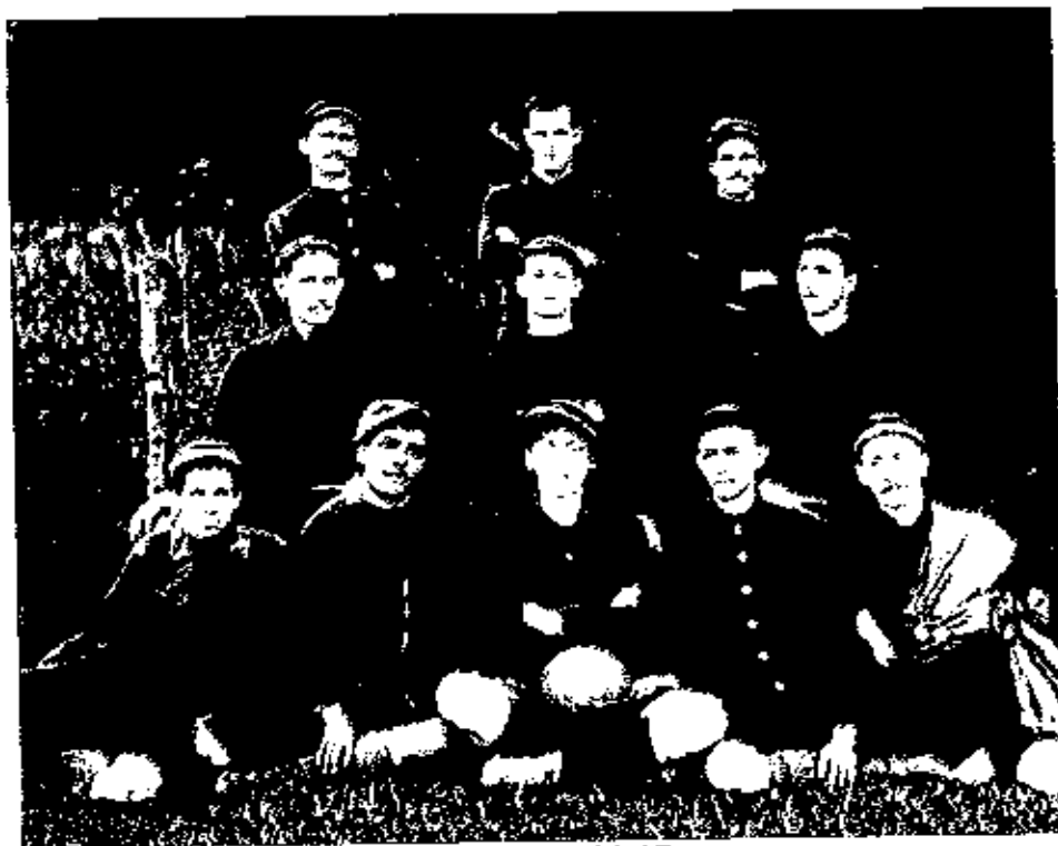
Time de 1911-15

O Clube 15 de Novembro é uma agremiação do Município de Campo Bom, que fica a 57 km da capital Porto Alegre (RS). Fundado no dia 15 de novembro de 1911 , como Sport Club 15 de Novembro , por operários da primeira indústria de calçados de Campo Bom, a Vetter & Irmãos .