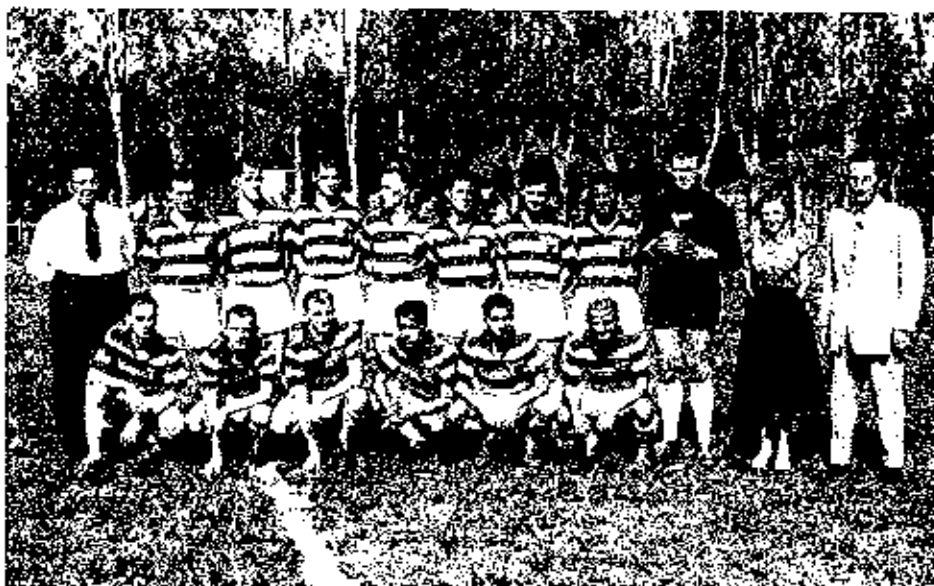
Time de 1953

O EC Independente existiu por mais seis anos até que em 1949, o clube voltou a se chamar Esporte Clube 15 de Novembro , retomando as cores originais (verde, amarelo e vermelho), contudo com um distintivo um pouco diferente. Disputou o Campeonato Citadino de São Leopoldo até a emancipação do município de Campo Bom . Nos anos 60 voltou a usar o escudo no estilo original.