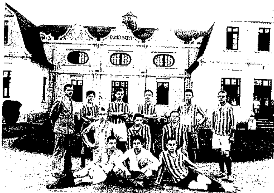
Time de 1933

Seus principais adversários eram SC Rio Grandense e EC Oriente , ambos de Campo Bom; SC Novo Hamburgo , FBC Esperança , SC Ypiranga , Grêmio Sp.Hamburguez , FBC Municipal , SC Progresso e SC Guarany todos de Novo Hamburgo, Sapyranga FBC e FBC Avante de Sapiranga , Estância Velha FBC , SC União de Estância Velha , SC Tiradentes de Dois Irmãos .