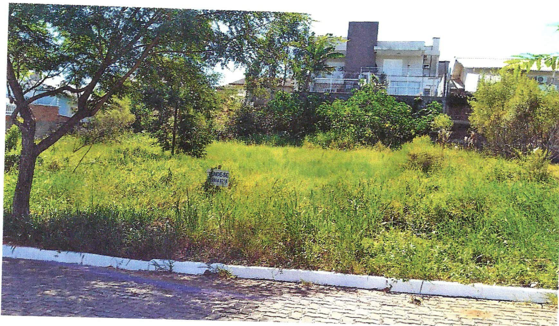
RUA PEDRO CANISIO FORNECK, Nº. 281