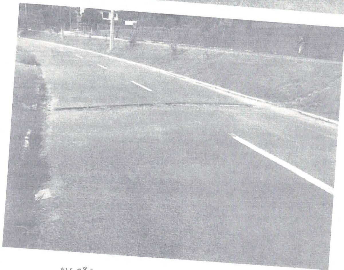
AV. SÃO LEOPOLDO, SENTIDO CENTRO BAIRRO, ALTURA DO Nº 920, EM FRENTE A E.E. FERNANDO FERRARI.