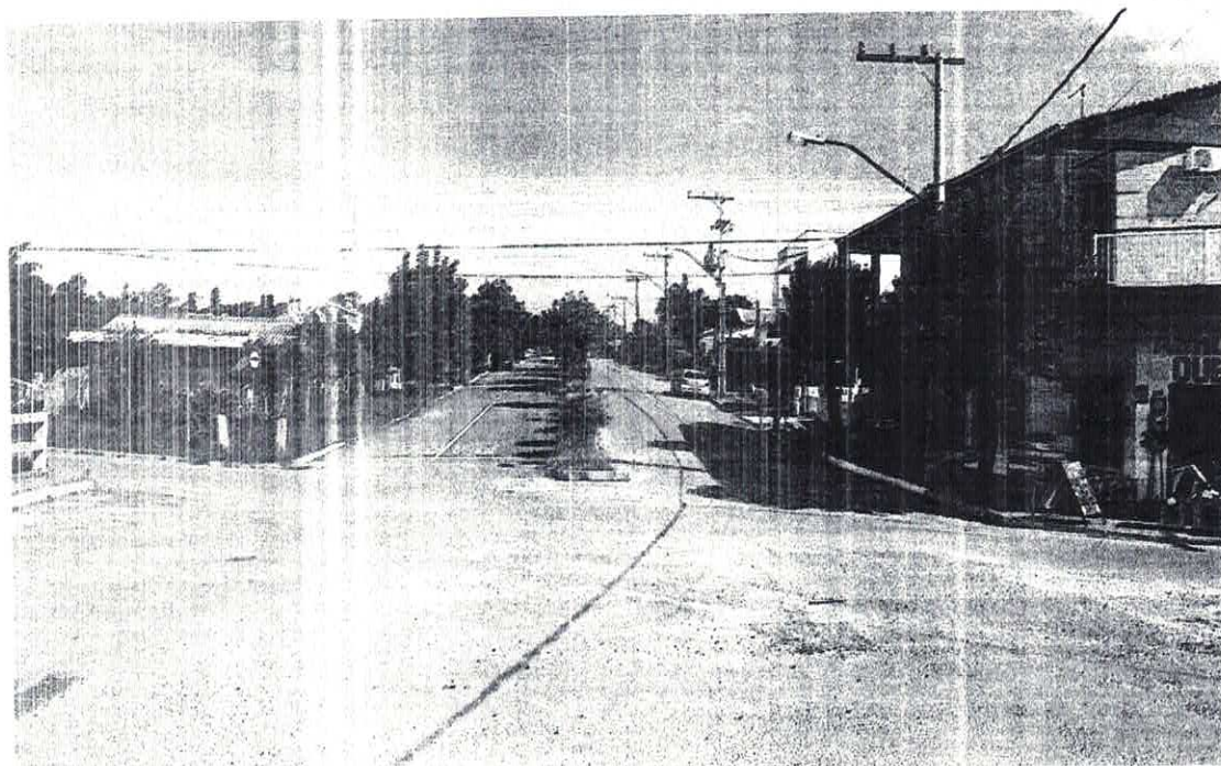
AVENIDA JOÃO XXIII, SENTIDO BAIRRO/CENTRO